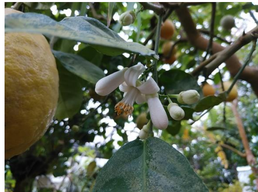
芳香を放つレモン‘ポンデローザ’の花