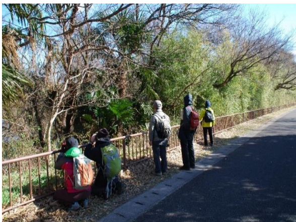
【風を避けた水辺で探鳥中】

大勢の人と強風という過酷な条件下での野鳥観察となりましたが、参加者が達人揃いですから気が付けば開始から3時間半の時間があっという間に過ぎていました。