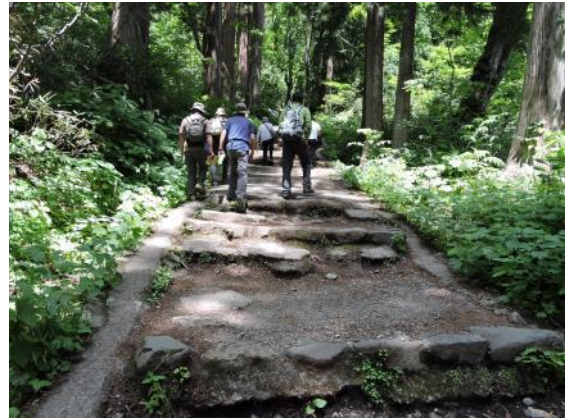
ランダムな階段が「ちょっとキツイ」

今回の観察会のお宿は、民宿「かくひら館」さんにお世話になりました。こちらでは「食用ホオズキ」という、観賞用とは異なる珍しいホオズキを育てています。朝食で御馳走になると、その甘酸っぱくトロピカルな味に魅了された我々は早速、お土産にジャムやドライホオズキを購入し、畑も案内していただきました。