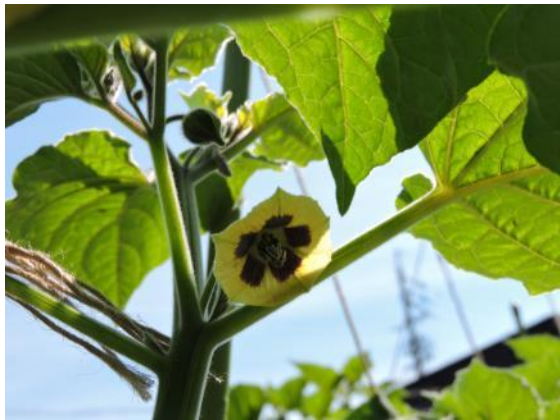
食用ホオズキの花

今回の観察会のお宿は、民宿「かくひら館」さんにお世話になりました。こちらでは「食用ホオズキ」という、観賞用とは異なる珍しいホオズキを育てています。朝食で御馳走になると、その甘酸っぱくトロピカルな味に魅了された我々は早速、お土産にジャムやドライホオズキを購入し、畑も案内していただきました。