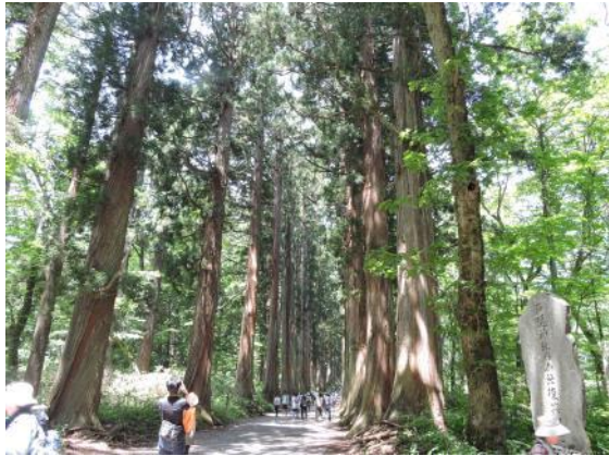
奥社へ続く杉の参道