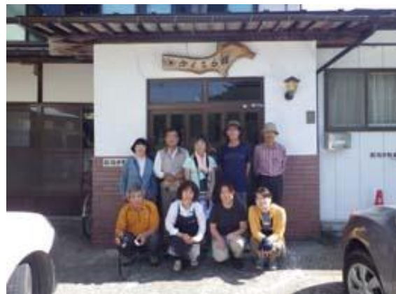
お世話になった民宿「かくひら館」の前で