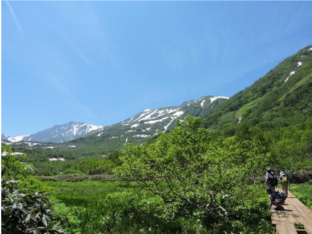
湿原に敷かれた木道を歩く

梅池自然園にはリフトとゴンドラを乗り継いで30分、徒歩10分ほど。標高が高くなるにつれ爽やかな風が吹き渡り、期待も高まります。湿原に一步踏み入ると、ミズバショウやコバイケイソウの群生する、まるで天国のような光景が広がっていました。各々のペースで木道を歩き、ひっそりと咲くシラネアオイやベニバナイチゴ等を見つけながら散策を楽しみました。散策路の途中には雪が残っており、火照った体に心地よい冷たい風があたりました。その雪解け水の流れる、手がシビれるほど冷たい沢をイワナが平然と泳いでいました。