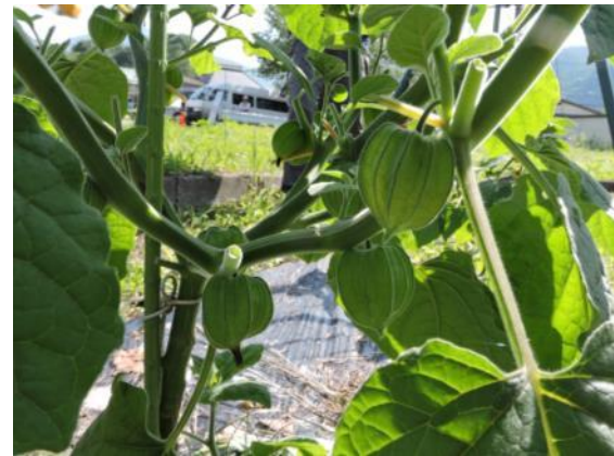
食用ホオズキの実。収穫はこれから