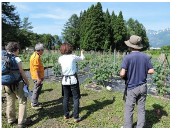
食用ホオズキの畑を見せてもらう