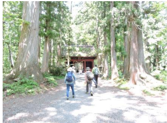
ここから杉並木が続く