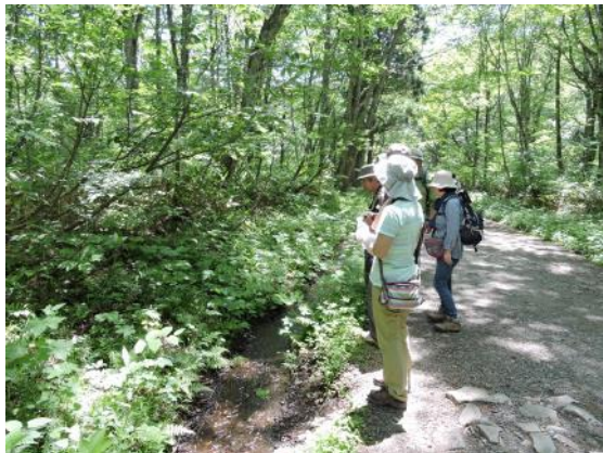
「あれは何でしょう？」

二日目には戸隠古道を訪れました。大鳥居から砂利道の参道が続いており脇には沢が流れていました。随神門をくぐると絵画のように美しい杉並木が続いていました。ここでも各々のペースで進み奥社へ参拝した後、解散となりました。