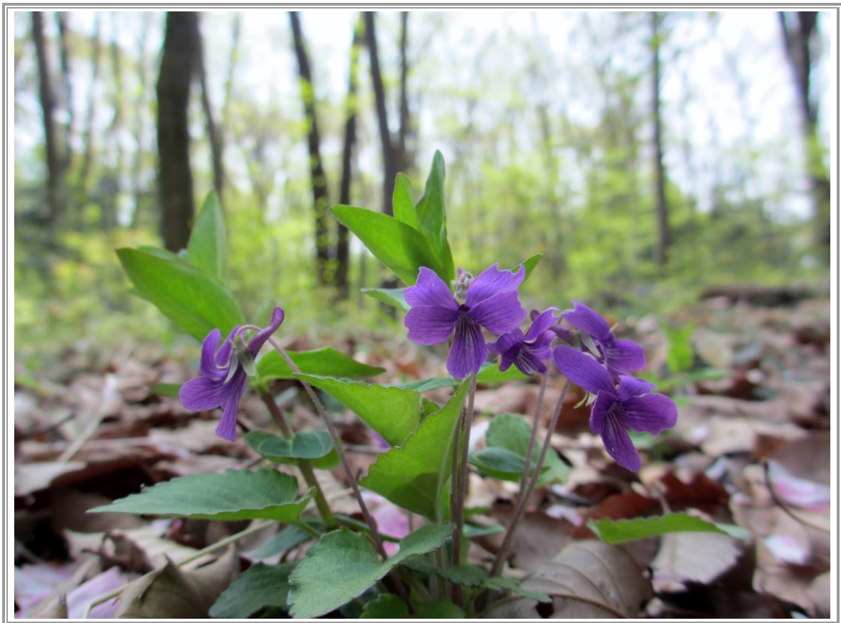
“墨入れ壺” に名の由来のあるスマイレ 下富フィールド 2015.4.12