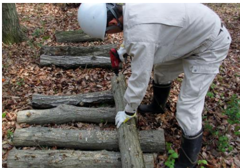
電動ドリルでの穴あけ作業

また、今日も以前のほだ木にはたくさんのシイタケが出て、参加者はじゃんけんゲームでそれぞれの戦利品を持ち帰った。