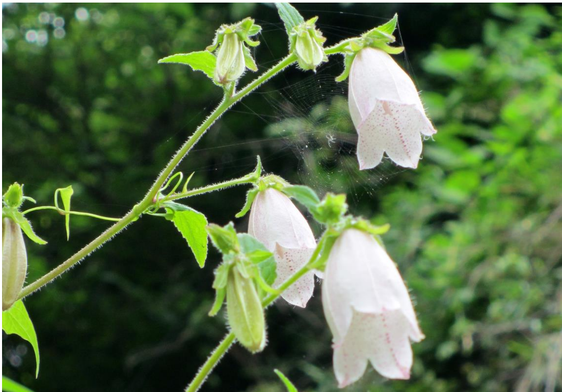
シマホタルブクロ? 鎌倉極楽寺付近 2014.6