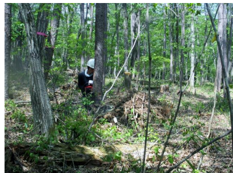
チェーンソーで伐採するKさん