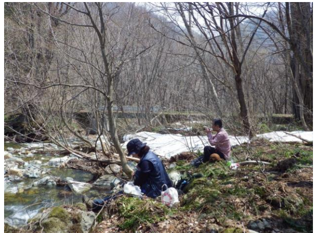
【雪解けの瀬音を聞きながらお弁当】