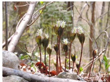
【賑やかなフタリシズカ】