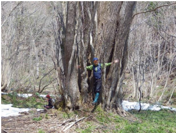
【カツラの巨木にはときおり妖精が現れる？】