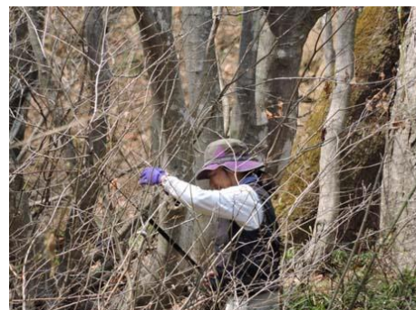
【こっそりとイワナ釣り】