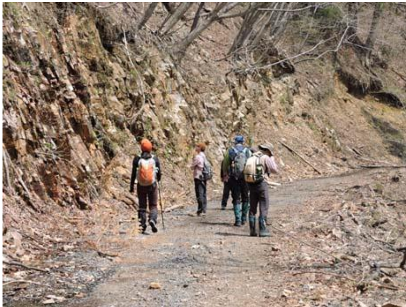
【大出俣林道を散策中】

晴天に恵まれた4月26日(土)、今年度最初となる春の観察会を開催しました。参加者は、5人の会員に2名のゲスト参加者を加えた総勢7名です。