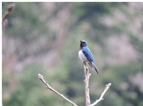
【瑠璃色の宝石オオルリ】