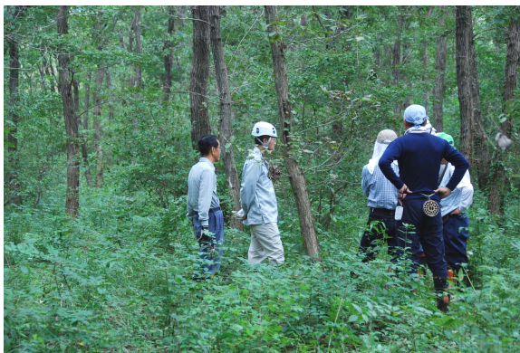
下富グループの見学会