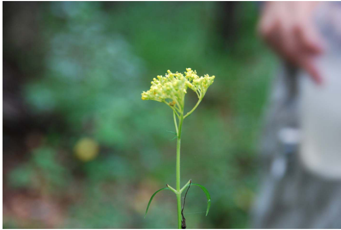
第2フィールドにオミナエシが咲いていました。 2011.09.04 撮影 三芳フィールド