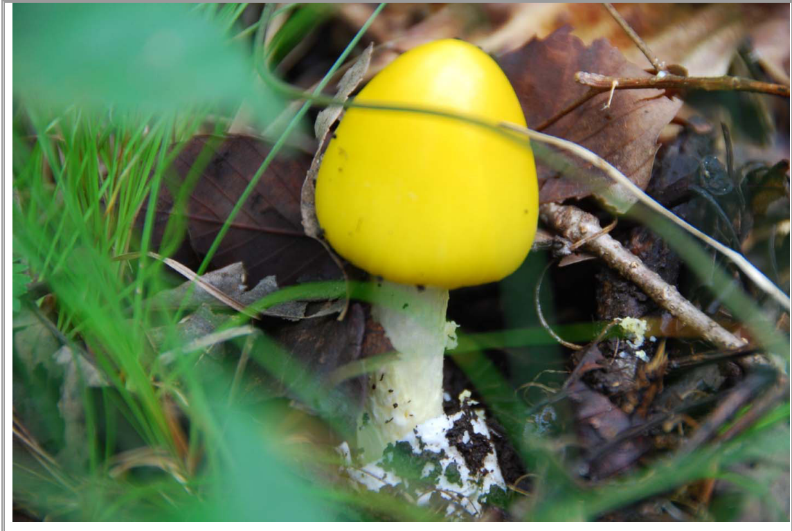
キイロタマゴタケ