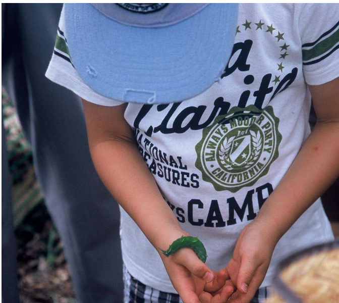
オオムラサキの幼虫