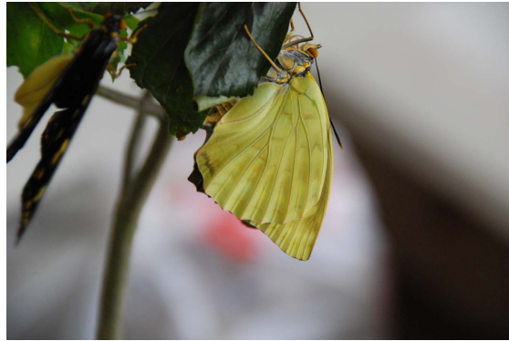
生まれたてのオオムラサキ