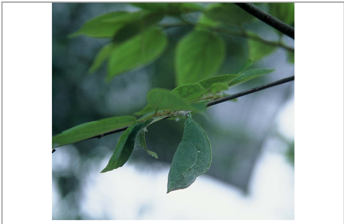
オオムラサキのサナギ。