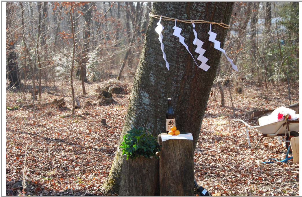
今年も無事を祈願

【今月のお知らせ】【今月の活動報告】【次回の活動予定】【お知らせ/募集】 【編集後記】