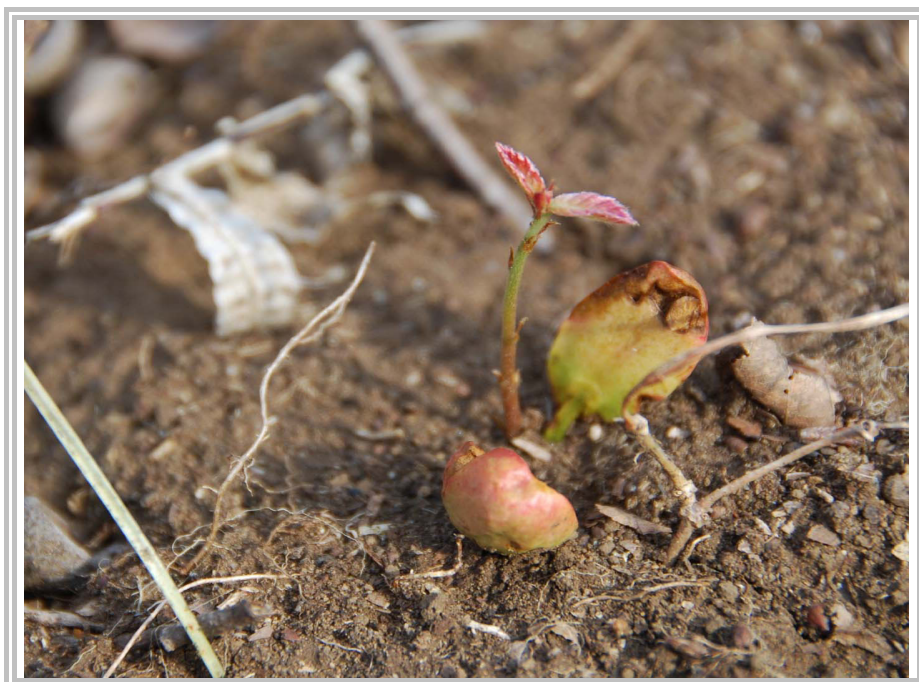
4月新年度スタートです。

【今月のお知らせ】【今月の活動報告】【次回の活動予定】【今月のレポート】 【お知らせ/募集】【編集後記】