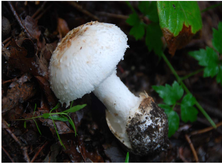
謎のキノコ 第3フィールドにて2009.8.2撮影