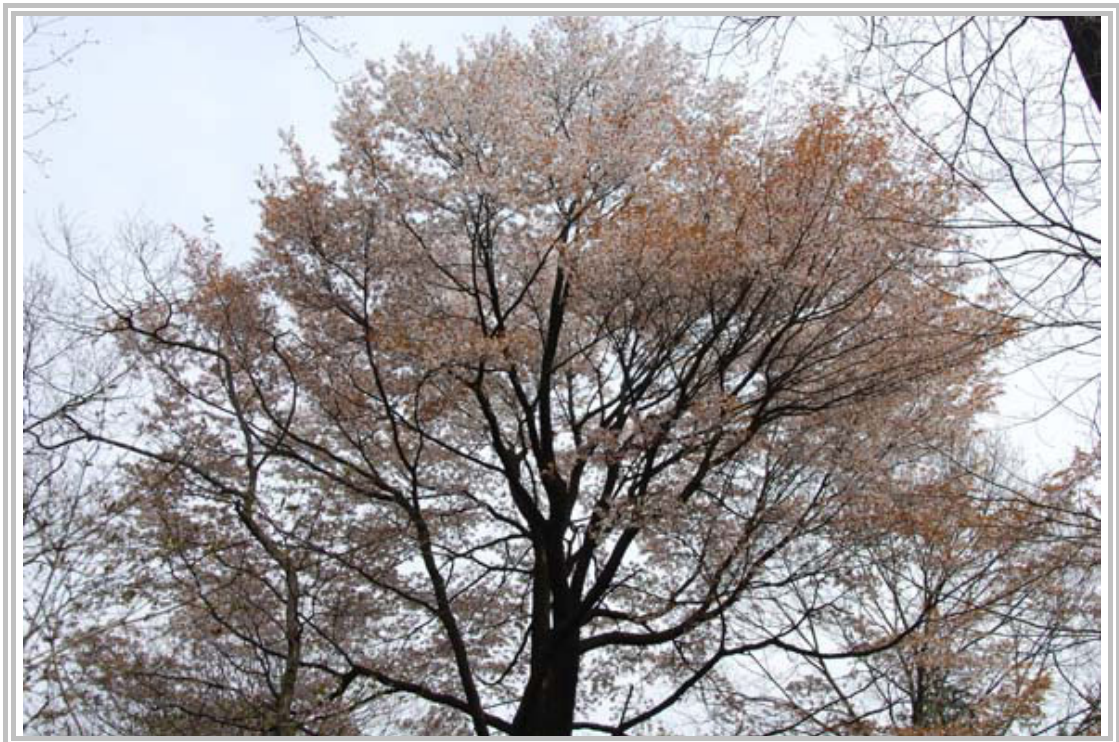
4月の様子 第2フィールドのヤマザクラ